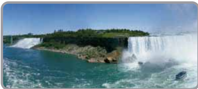
Cataratas del Niagara