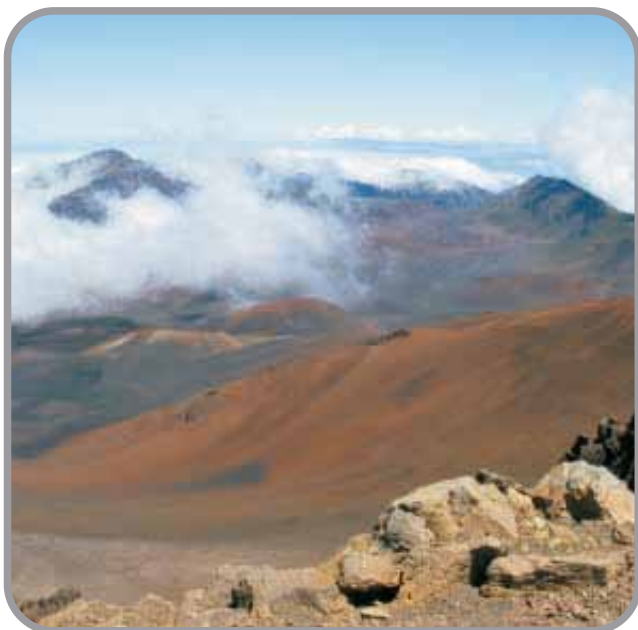
Cráter de Haleakala

Salida en horas de la mañana con destino al pueblo de Wailuku, oeste de Maui, en este viven diferentes grupos étnicos polinesios, donde sus habitantes trabajan en las plantaciones de caña de azúcar. Podremos disfrutar del Iao Valley es un exuberante valle tropical y un lugar excelente para los excursionistas. La parte más famosa del valle es Iao Needle, una formación rocosa que se eleva 365 m (1,200 pies) y está cubierta con vegetación tropical. Está rodeada de los acantilados del volcán extinto Puu Kukui y su cima está usualmente escondida entre las nubes. Conoceremos la Iglesia de Kaahumanu. Y terminaremos con una impresionante vista en Lahaina (lookout Papawai). Regreso al hotel en horas de la tarde.