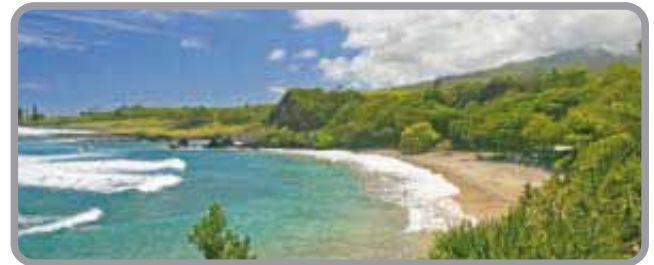
Playas de Maui

La isla de Maui fue creada millones de años atrás por dos volcanes (West Maui Mountains y Haleakala) que emergieron conjuntamente formando un gran valle entre estas dos montañas. Conocida como "la isla del valle" Maui ofrece a sus visitantes un sin número de actividades que harán de su estadía un recuerdo inolvidable. Paisajes que activan todos los sentidos del cuerpo, con vegetaciones y accidentes geográficos de increíble belleza natural, han hecho que esta isla haya sido votada varias veces como la mejor isla de el mundo por las revistas mas reconocidas en la industria del turismo. Los mismos habitantes de Maui se refieren a esta isla como "Maui No Ka Oi" (Maui la mejor).